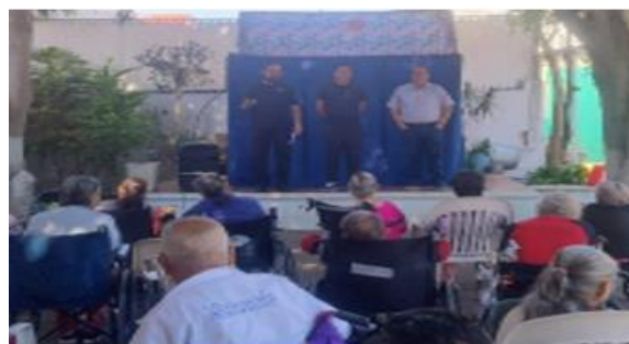
Foto 1. Dramatización con títeres.

El objetivo general es fortalecer la comprensión lectora en adultos mayores mediante actividades con títeres bocones.