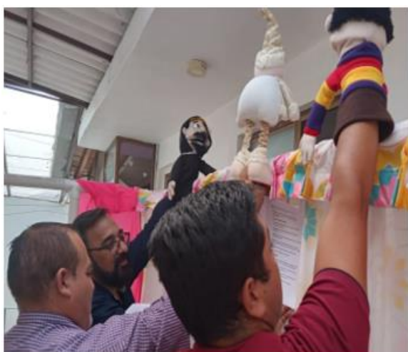
Foto 2. Dramatización con títeres.

Transformación: Inicialmente, los adultos mostraron baja motivación y escasa participación. Sin embargo, al introducir los títeres bocones, se generó un cambio emocional profundo. Los adultos comenzaron a sonreír, aplaudir y mostrar entusiasmo. El títere se convirtió en un puente emocional que despertó recuerdos, alegría y disposición para participar.